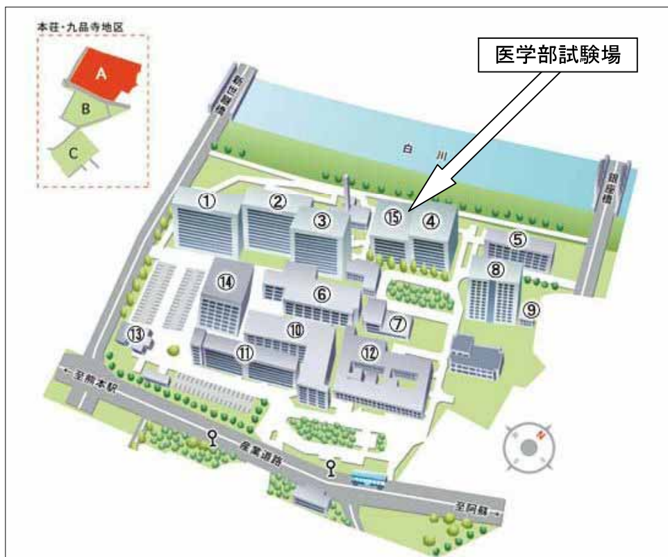
医学部試験場 ⑮医学教育図書棟