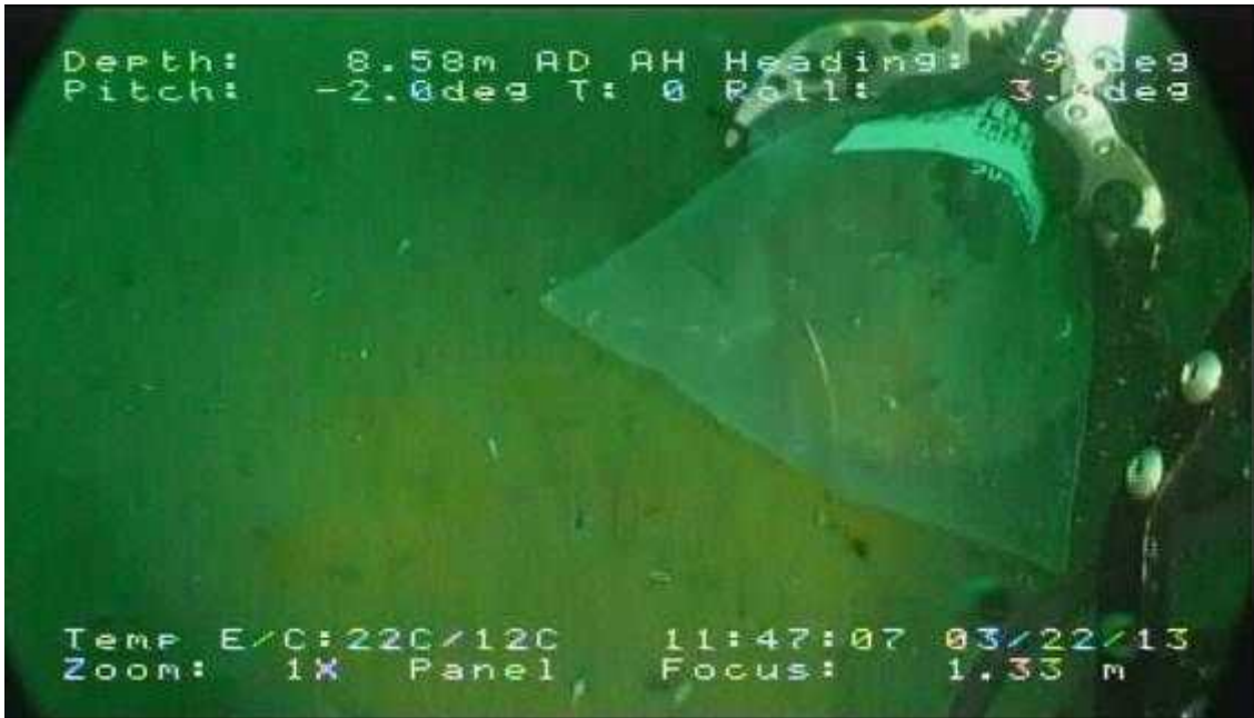
資料1 ロボットによる採泥（気仙沼市梶ヶ浦漁港）