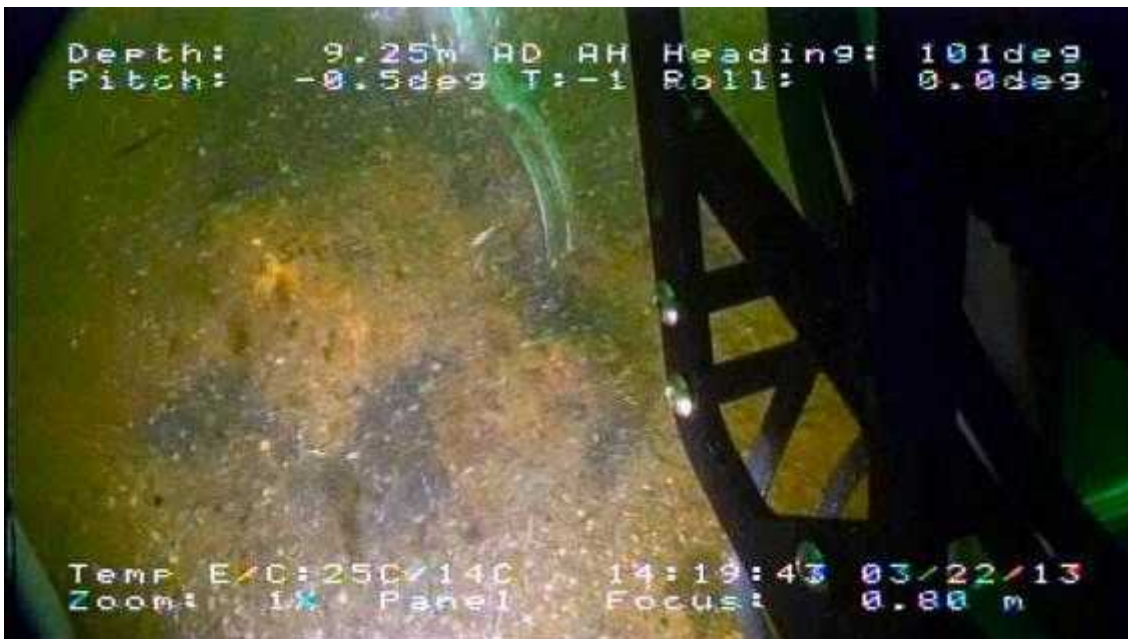
資料2 小型の瓦礫の採集と巻き上がる油混じりの細粒堆積物（気仙沼港）