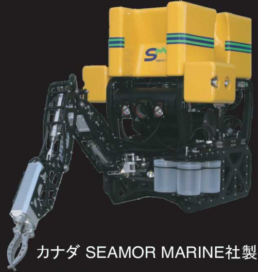
カナダ SEAMOR MARINE社製