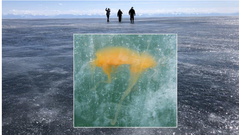
写真： 氷結したバイカル湖でサンプリング地点に向かう調査隊と氷の隙間に生じた渦鞭毛藻のコロニー