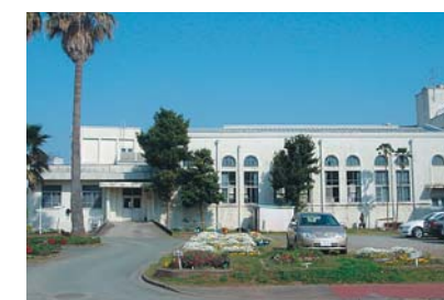
⑭ 給食センター (昭和6年完成、昭和45年増築) 建築面積 592㎡ 延床面積 592㎡ 階数 地上1階 構造 鉄筋コンクリート造