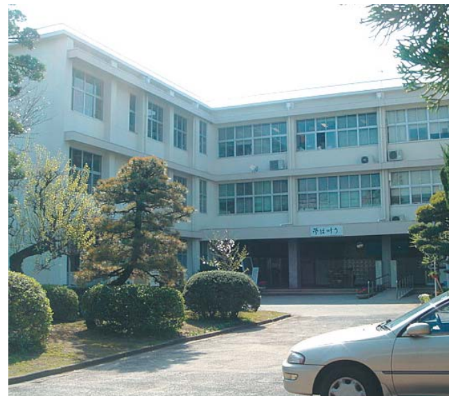
② 附属中学校校舎(昭和40年完成、昭和43年増築) 建築面積 1,202㎡ 延床面積 3,626㎡ 階数 地上3階 構造 鉄筋コンクリート造