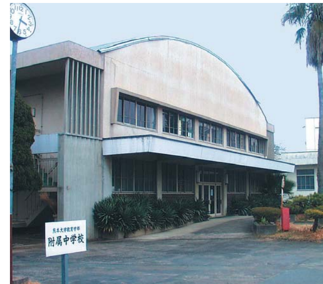
④ 附属中学校体育館(昭和40年完成) 建築面積 820㎡ 延床面積 979㎡ 階数 地上2階 構造 鉄骨造