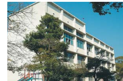
⑨ 附属小学校校舎(昭和40年完成) 建築面積 439㎡ 延床面積 1,223㎡ 階数 地上3階 構造 鉄筋コンクリート造