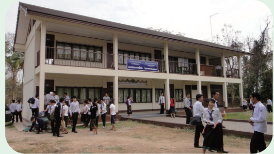
ラオス国立大学日本語学科

2011年3月1日、2日の両日、国際語学部門の日本語教育担当教員2名が、ラオス国立大学（ラオス、ヴィエンチャン市）を訪問しました。ラオス国立大学では2003年、文学部に日本語学科が設置され、本学には2009年に初めて留学生が1名やってきました。この3月、ラオス国立大学と本学で交流協定が結ばれることになり、今後交換留学生の受け入れなど、交流が深まることが期待されます。