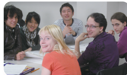
英語による短期留学プログラム科目 授業風景

熊本大学短期留学制度は、外国の協定大学の正規課程に在籍する外国籍の学生を対象とした短期留学制度で、日本語習得、日本及びアジアの社会文化、先端の科学技術、諸外国の学生との交流等に関心を持つ学部レベルの外国人学生に、母校に在籍のまま1年間を最長とする短期留学の機会を提供しています。平成17年度にこの制度が始まり、今までに200名以上の留学生を受け入れて来ました。現在の短期留学コースは、コースⅠ(短期留学プログラム)、コースⅡ(一般短期留学)があり留学生は希望のコースを選び、それぞれの修了要件を満たすと修了証書が発行されます。現在は協定校から約50名以上の留学生が受講しています。