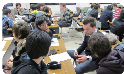
日本語クラス 日本人学生との会話練習風景

熊本大学にはこの他に、日本語・日本文化に関する分野を専攻する学部レベルの留学生を対象とした一年間の国費留学生のためのプログラム(日本語・日本文化研修プログラム)があります。日本語能力を高めると同時に、日本を対象とした研究を行う上で必要となる知識、技能及び社会で役立つ日本語・日本文化に関する様々な知識を身につける事を旨とするので、現在のプログラムにはコースが2つあります。熊本大学では、この国費留学生を今までに120名以上受け入れて来ました。現在は、中国とポーランドからの留学生2名が受講しています。