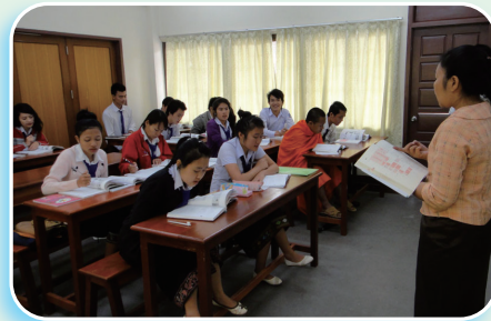
日本語の授業風景

これからの発展に向けて一歩一歩進んでいく同学科と日本語教育を通して密接な協力関係が構築できたと願っています。