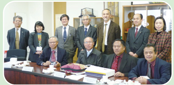
生命科学系への表敬訪問

また、3月3日には自然科学研究科を表敬訪問し、調印式をとりおこない、本学理学部・工学部・自然科学研究科との部局間交流協定を締結しました。ブラウィジャヤ大学からは過去、自然科学研究科を中心に留学生を受け入れており、今回の表敬訪問と協定締結により、今後のさらなる交流の発展が期待されます。